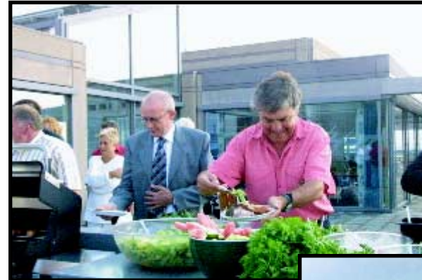
Ona og Aamodt forsyner seg.